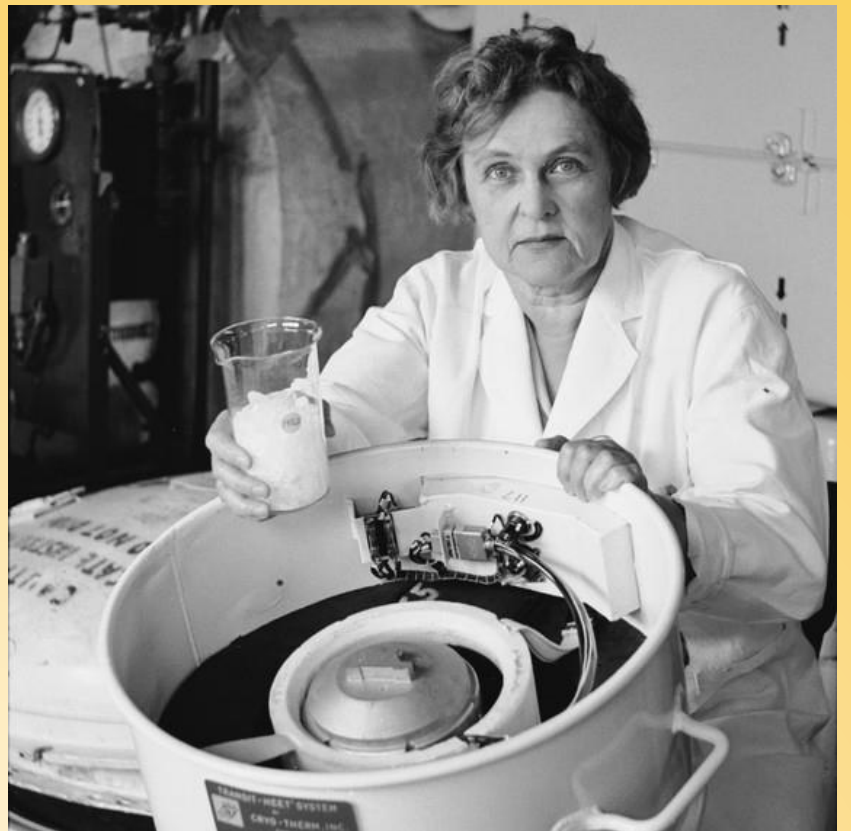
Maria Telkes con uno de sus dispositivos termoeléctricos.

Tenía varios campos de trabajo, fue inventora y además investigó sobre la energía solar, teniendo un Doctorado en Fisicoquímica.